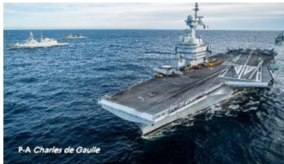
P-A Charles de Gaulle

UNE CENTAINE DE BÂTIMENTS DE COMBAT ET DE SOUTIEN ET 10 000 MARINS