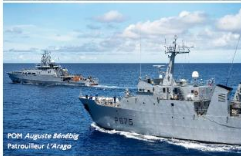
POM Auguste Bénébig Patrouilleur L'Arago